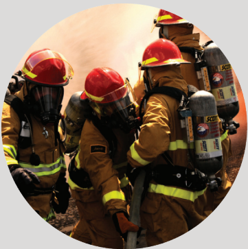
Personnel Fire Protection Equipment