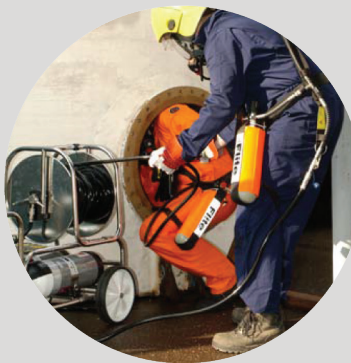
Breathing Devices/ Air Compressor