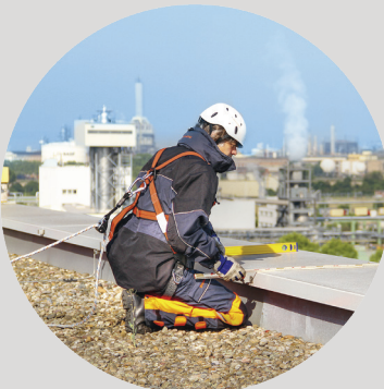
Fall Protection Equipment