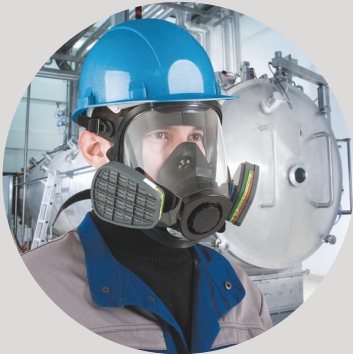
Personnel Protective Equipment