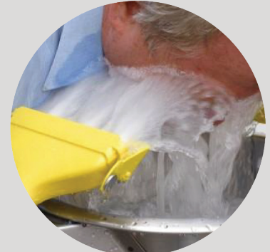
Environmental Control Device