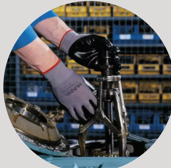
Hand/ Foot/ Body Protection Equipment